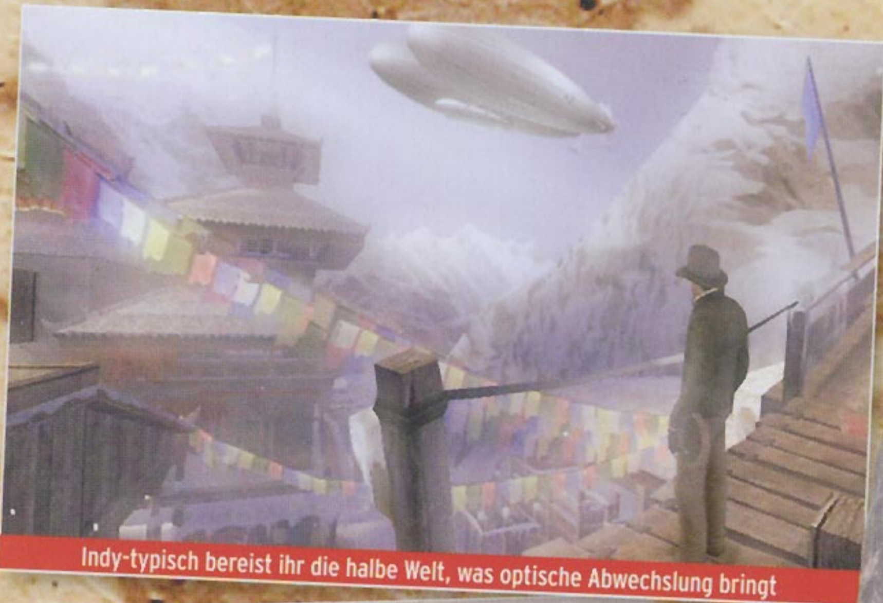
Indy-typisch bereist ihr die halbe Welt, was optische Abwechslung bringt